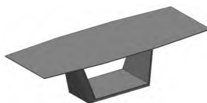
Tisch nicht ausziehbar