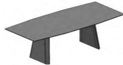
Tisch nicht ausziehbar