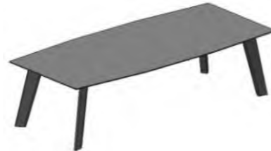
Tisch nicht ausziehbar