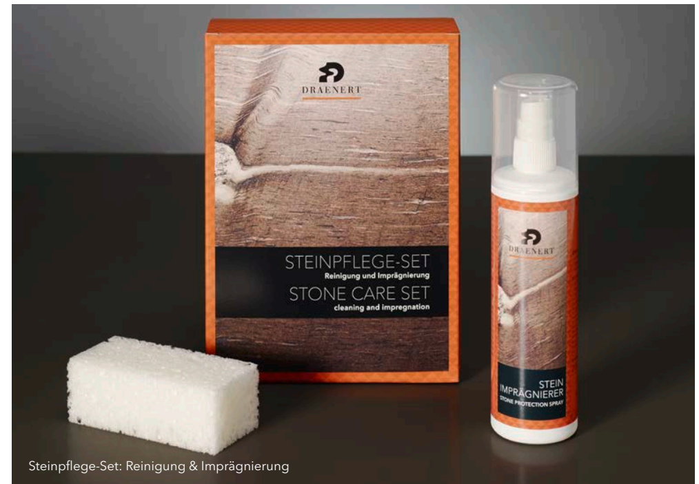
Steinpflege-Set: Reinigung & Imprägnierung