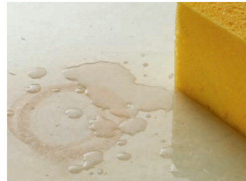
Kräftiges Nachwässern mit einem nassen Schwamm