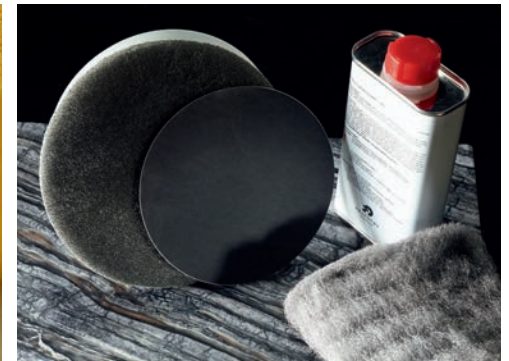
Reparatur-Set für kleine/mittlere Säureschäden